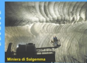
Miniera di Salgemma